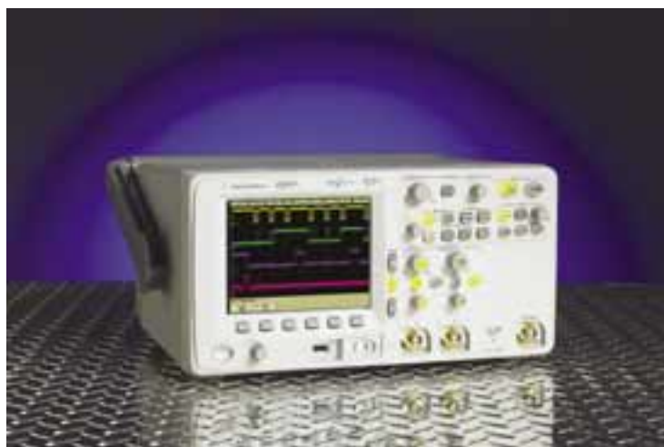
Un modello di oscilloscopio della famiglia Agilent 6000 Series

comunicazione degli strumenti Vxi (Vme eXtensions for Instrumentation) e Pxi (Pci eXtensions for Instrumentation). I nuovi apparati devono inoltre utilizzare interfacce ampiamente diffuse e disporre di tool software facilmente integrabili. "L'integrazione degli strumenti in banchi di collaudo automa-