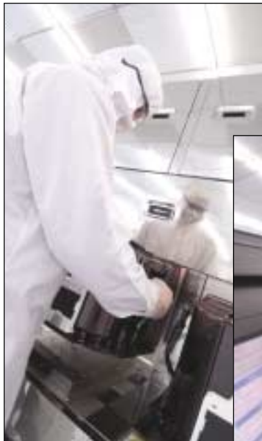
Due vedute della camera bianca per i wafer a 300mm, dotata degli strumenti per la litografia

Ad esempio, nell'ambito delle applicazioni per i futuri sistemi multimediali wireless, anche Freescale Semiconductor,