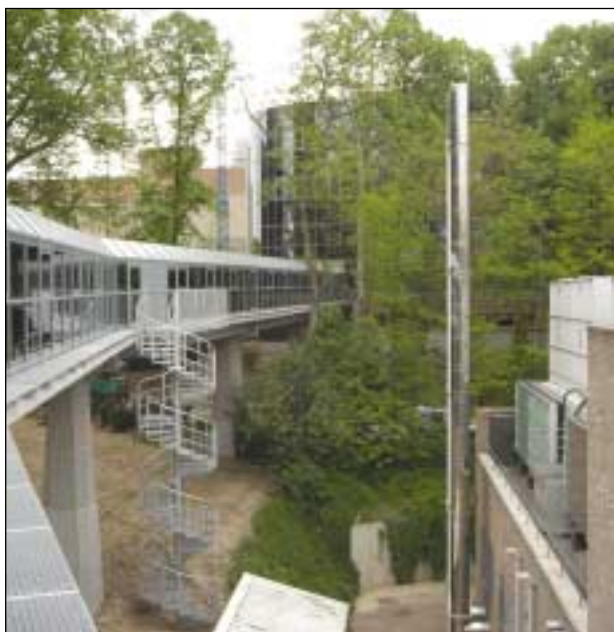
Un ponte collega gli uffici del centro ricerche con la camera bianca

Come ha spiegato il presidente e amministratore delegato di Imec, Gilbert Declerck, i punti di forza di questo centro di ricerca non stanno solo nella capacità di riunire sotto un'unica location la progettazione, la realizzazione di sistemi e circuiti integrati e le attività di ricerca sulle nanostrutture, ma anche nella